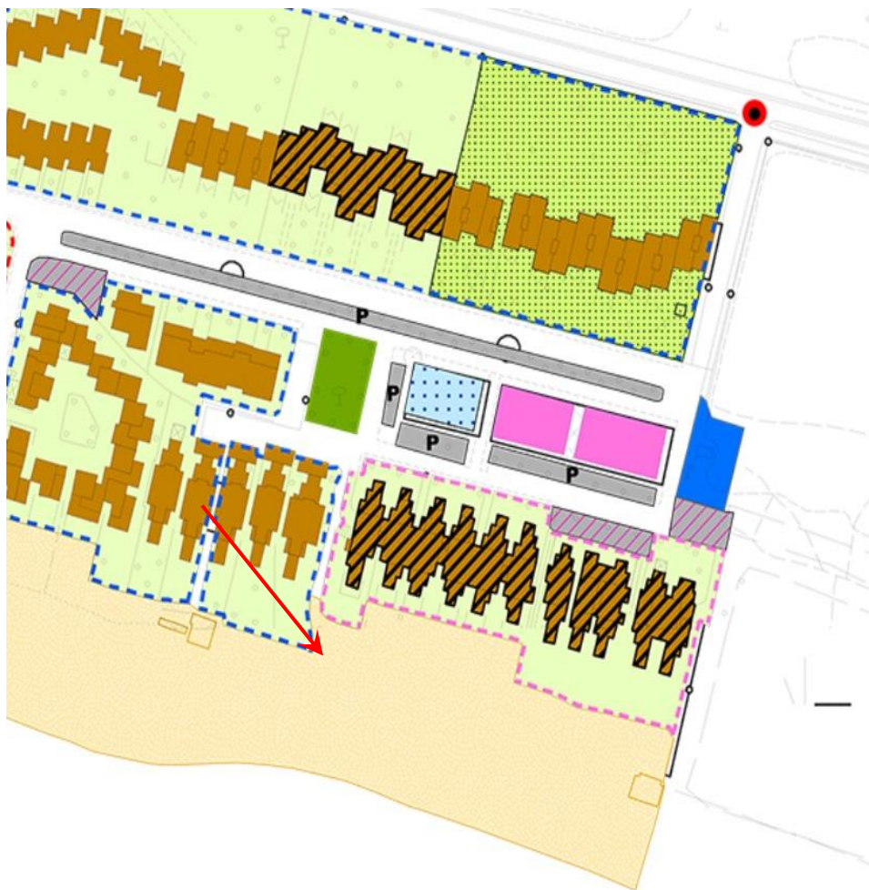
Foto n.° 2: Ubicazione dell'area oggetto d'intervento all'interno del R.U. approvato.

L'intervento in oggetto insiste sulla fascia costiera demaniale ed è l'installazione a carattere temporaneo (90gg) di una struttura modulare, a tre blocchi in legno, di dimensioni singole pari a mt. (1,50x1,50), dove vi realizzeremo un servizio igienico sanitario, una doccia da esterni e un piccolo deposito/ripostiglio, oltre che ad un'installazione sempre temporanea di passerelle in plastica riciclata con " n°6 isole" di dimensioni mt.