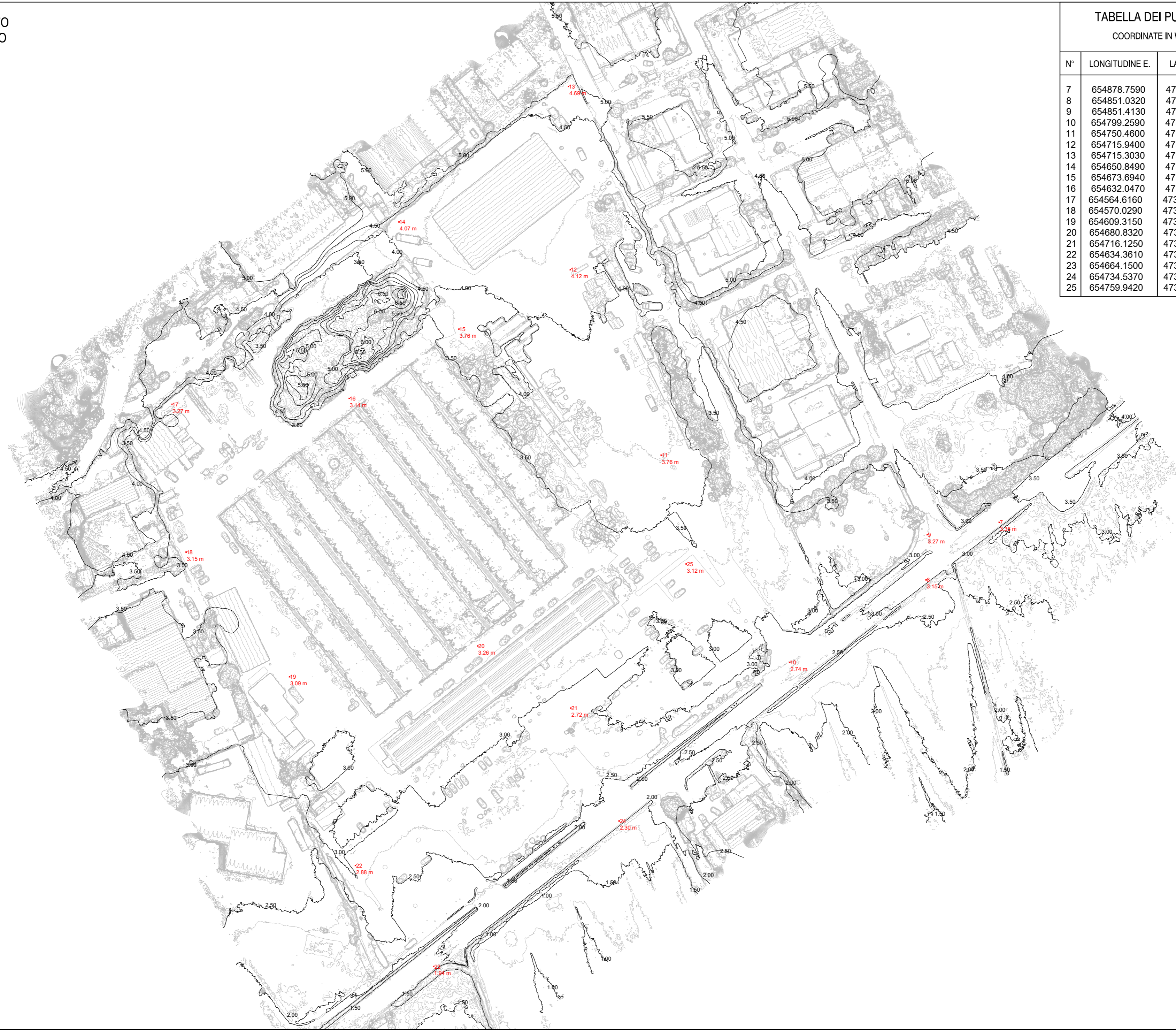
TABELLA DEI PUNTI FIDUCIARI