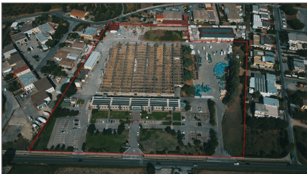
La zona d'intervento

Per l'attuazione di questo progetto l'Amministrazione ha posto in essere specifiche azioni finalizzate ad intercettare le risorse finanziarie dei privati attraverso lo strumento del partenariato. Una forma di cooperazione tra soggetti pubblici e privati , con l'obiettivo di finanziare, costruire e gestire infrastrutture o fornire servizi di interesse pubblico .